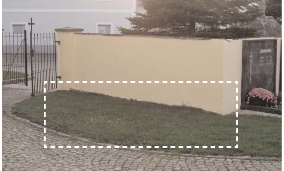
Vorgesehener Platz für Urnengräber

1964 wurde im kath. Kirchenrecht das Verbot der Feuerbestattung aufgehoben (Im Codex Iuris Canonici Canon 1176 Paragraph 1 heißt es: "Den verstorbenen Gläubigen ist nach Maßgabe des Rechts ein kirchliches Begräbnis zu gewähren"- und im Paragraph 3: "Nachdrücklich empfiehlt die Kirche, dass die fromme Gewohn-