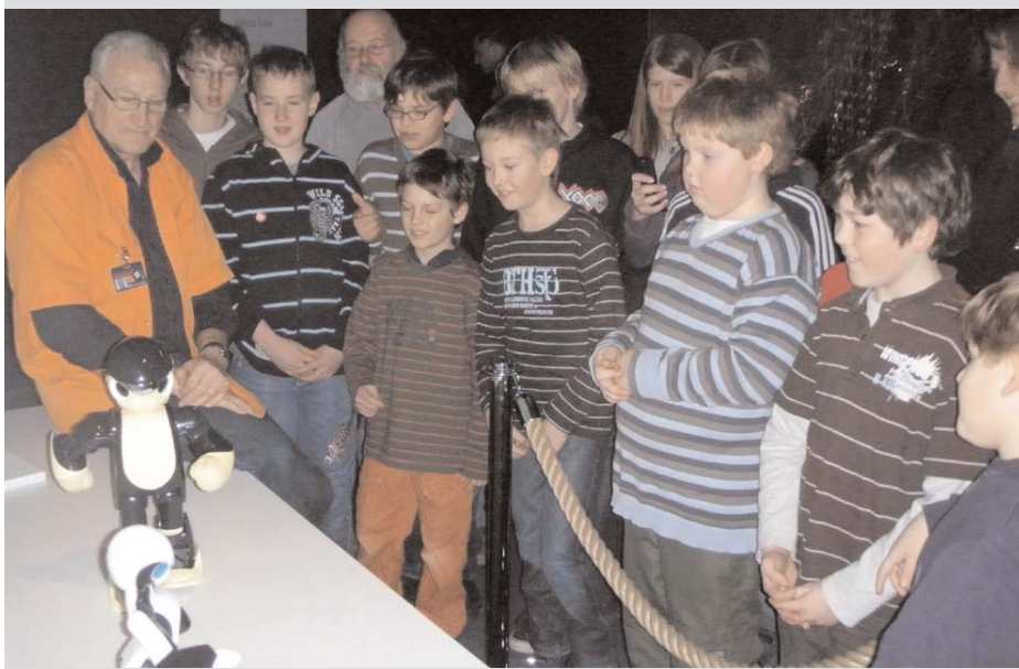
Die Roboter marschieren für die Goldwörther!