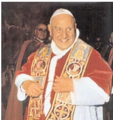
Papst Johannes XXIII.

Und was ich mir noch wünsche: Wieder einmal einen Papst wie Johannes XXIII.