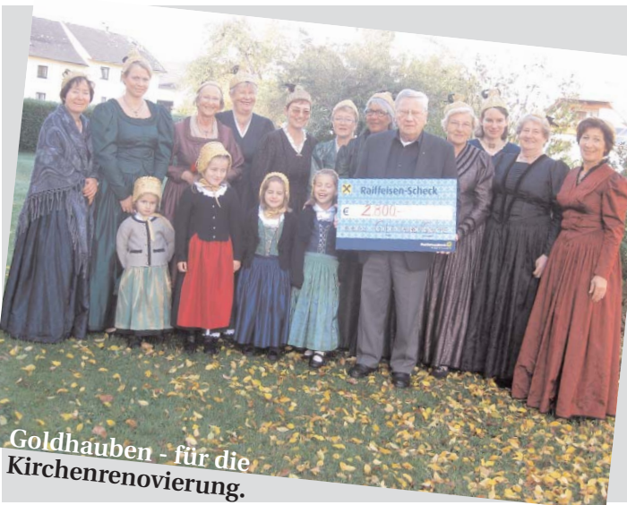
Goldhauben - für die Kirchenrenovierung.