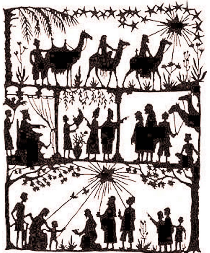
Eine Scherenschnitt-Krippe.

Im unteren Bild haben die Weisen den Stall erreicht. Aber anders, als man gewohnt ist – liegt das Kind nicht in der Krippe. Es eilt von sich aus den Männern entgegen – kein hilfloses Kind also, sondern von den ersten Tagen an ein Entgegenkommender. Das ist Jesus: Das Entgegenkommen Gottes für die Menschen. Jesus, der sich nicht hinter Barrieren verbirgt. Zugänglich, ansprechbar ist er, ja, er geht selbst den ersten Schritt. Damit ist eine neue Art der „Herrschaft“ auf die Welt gekommen.