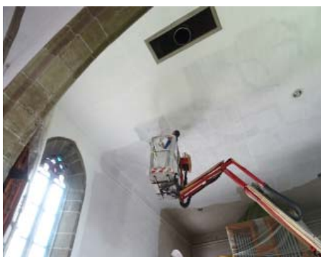
Der Kircheninnenraum wird neu ausgemalt. Pesendorfer