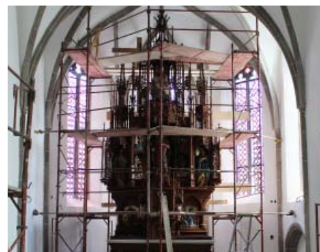
Die Altäre wurden gründlich gereinigt. Rammerstorfer