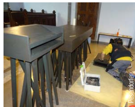
Ambo und Altar werden aufgebaut. Pesendorfer