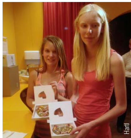
Selbstkreierte Lebkuchenherzen. Hartl

„Das war ein cooler Tag heute!“ lautete der Kommentar eines Ministranten auf dem Rückweg zum Bus.