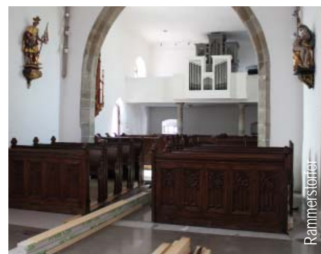
Die restaurierten Kirchenbänke werden wieder aufgestellt. Rammerstorfer