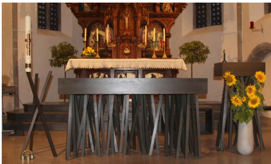
Neuer Altar, Ambo und Osterkerzenhalter.

Daran möge uns unsere neue Kirche erinnern – und so danke ich allen, die ihren Glauben in unsere Kirche gebaut haben. Dieser eingebaute Glaube möge sich einschreiben in unsere Herzen, sodass wir diesen Glauben begeistert und mit Freude leben und ihn für andere bezeugen. Zum Wohle unserer Pfarre Goldwörth und all seiner Bewohner.