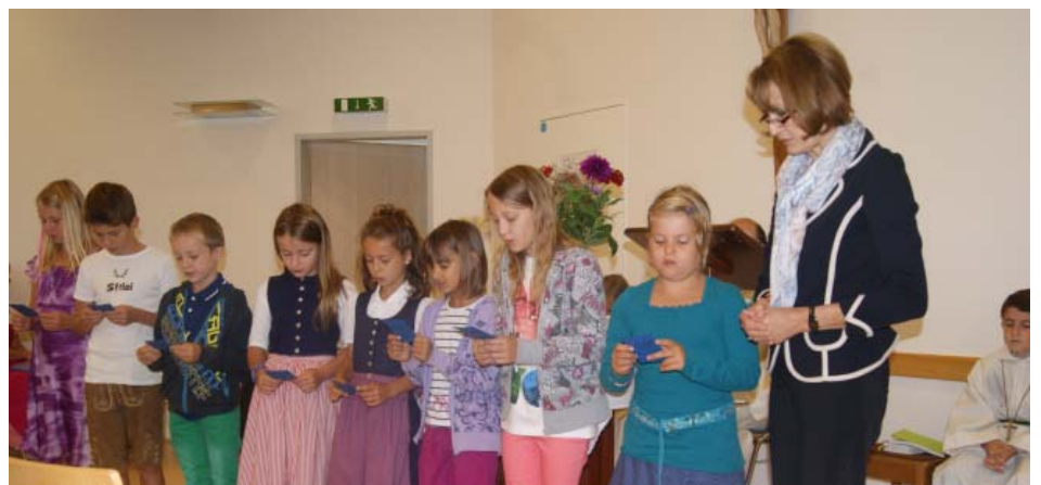
Die neuen Ministranten sprechen gemeinsam ein Gebet. Weinzierl