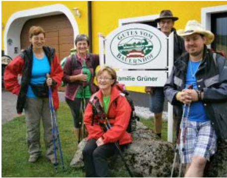
Die Wallfahrer in Hagenberg. Hofer

Am Maria Himmelfahrtstag trafen wir uns vor der Pfarrkirche Goldwörth zu unserer jährlichen Fußwallfahrt.