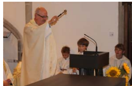
Der Ambo wird gesegnet.