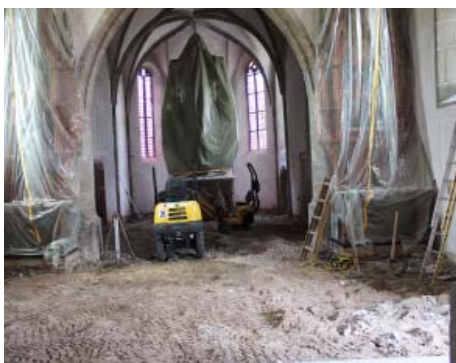
Der Fußboden wurde komplett entfernt.