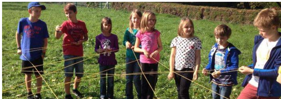
Die Jungscharkinder beim Auflösen des „Spinnennetzes“.

sind die beiden Leiterinnen der neuen Jungschargruppe. Zurzeit studieren wir an der Pädagogischen Hochschule „Volksschullehramt“ und freuen uns sehr, gemeinsam mit den Kindern vieles zu unternehmen. Spielen, Basteln, Turnen, Backen und noch mehr erwartet die Kinder. Uns ist es wichtig, die Freizeit der Kinder sinnvoll zu gestalten. Dadurch können wir wertvolle pädagogische Erfahrungen sammeln. Wir freuen uns schon, auf viele weitere lustige Jungscharstunden.