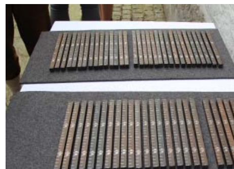
Die 65 Bausteine, die beim anschließenden Fest am Kirchenplatz ausgegeben wurden.