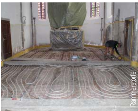
Die Fußbodenheizung wurde verlegt. Rammerstorfer