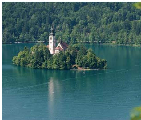
Kirche „Mariä Himmelfahrt“ mit der Wunschglocke auf der Insel in Bled.