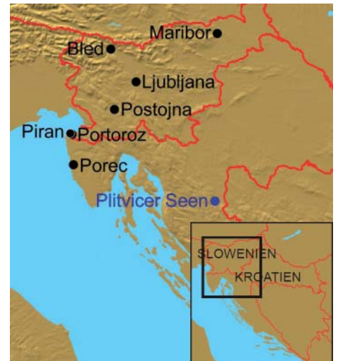
Überblick über die Städte entlang der Reiseroute. Moser-Reisen

Reisepreis: 560 Euro im Doppelzimmer (Einzelzimmer-Aufpreis: 85 Euro).