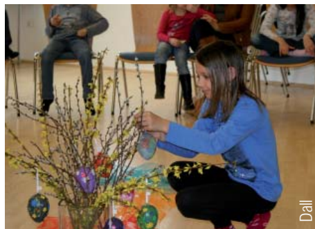
Kinder gestalten den Kreuzweg mit.

Auch heuer wollen wir etwas über Jesu Leben, die Freude, die er verbreitet hat, aber auch das Leid, das er erleben musste, erfahren. Das KILIT-Team würde sich freuen, wenn wieder viele Kinder diesen Kinderkreuzweg mitgestalten.