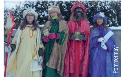
Bei winterlichen Verhältnissen waren die Sternsinger unterwegs.

„Drei Heilige Könige folgen dem Stern, der leitet die Menschen nah und fern. Erzählen euch von Not und Leid und bitten auch um Hilfe heut.“ Mit diesen Worten begannen die 22 SternsingerInnen, die Anfang Jänner von Haus zu Haus zogen, um die Goldwörther Pfarrbevölkerung um eine Spende für die Dreikönigsaktion zu bitten. Sie freuten sich, dass sie für diese Aktion 2.052,82 Euro sammeln konnten.