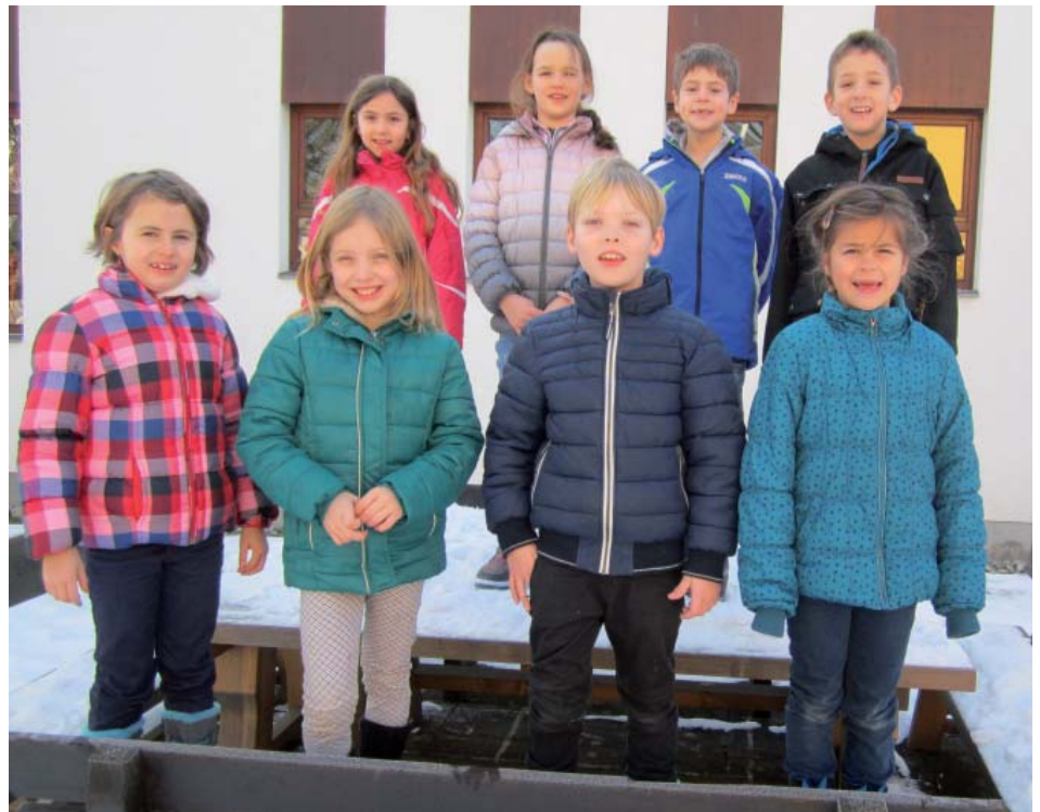
Ein Teil der Erstkommunionvorbereitung findet in der Schule statt. Arzt

ten erbitten wir für unsere Kinder auch Gemeinschaft: beim Singen, beim Beten, beim Feiern, beim miteinander Reden, bei allem, was uns gut tut und stark macht.