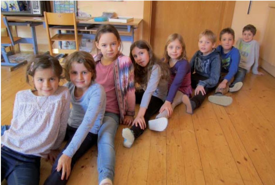
Heuer bereiten sich acht Kinder der Pfarre Goldwörth auf die Erstkommunion vor.