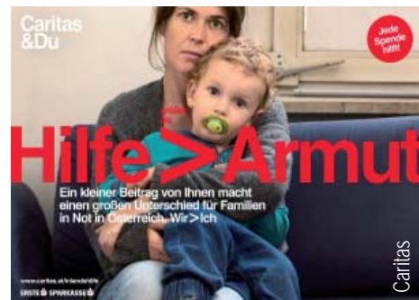
Spenden für Menschen in Not in OÖ.

Die kfb bedankt sich für die großzügige Spende von EUR 504,44.