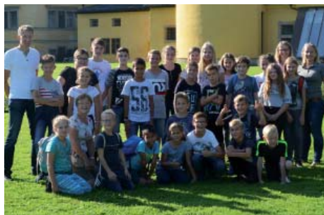
Viel Spaß hatten die Minis beim Ausflug nach Salzburg. Hartl