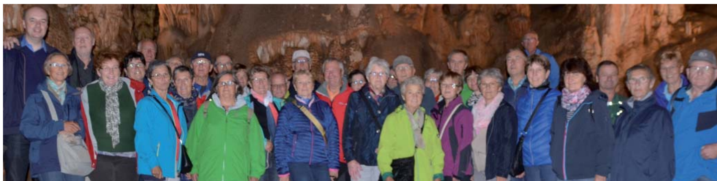
Die TeilnehmerInnen der dritten gemeinsamen Pfarrreise in der Höhle Domica.

Auch die nächste Pfarrreise ist bereits terminiert. Sie findet von 8. bis 12. Oktober 2019 statt und wird nach Südtirol führen.