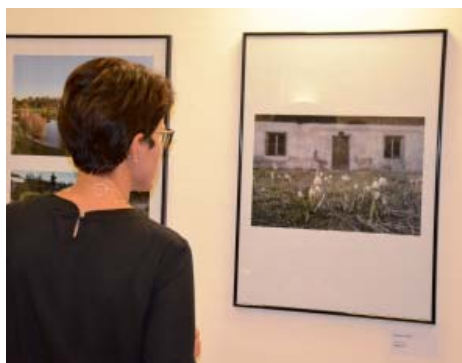
Fotos aus Goldwörth.

dern sind. Gerade für eine Gemeinde, die nach dem Hochwasser 2013 durch eine unglückliche Absiedlungspolitik der „Oberbehörden“ viele Gemeindebürger hat ziehen lassen müssen, ist es doppelt wertvoll, wenn es Bürger gibt, die sich in einem so hohen Grad mit der Heimatgemeinde identifizieren können. Daher ist es auch mehr als gerechtfertigt, dass die Gemeinde diese Ausstellung finanziell unterstützt hat. Einzelne Fotos können auch käuflich erworben werden. Der Reinerlös fließt einem caritativen Zweck zu. Besichtigt werden kann die Fotoausstellung noch bis Ende Jänner 2019 zu den Bibliotheksöffnungszeiten und während der Pfarrkanzleistunde am Mittwoch.