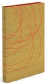
Das neue Lektionar.

Seit dem ersten Adventssonntag wird im ganzen deutschen Sprachraum bei den Gottesdiensten das neue „Lektionar“ verwendet. Dieses beinhaltet die Lesungen und Evangelien für alle Sonntag und Feiertage.