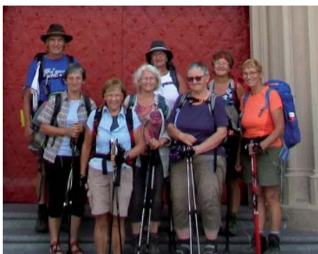
Die Pilger am Ziel ihrer Wallfahrt in Mariazell.

Im Laufe der Jahre bildete sich ein harter Kern an überwiegend weiblichen Pilgern heraus, die dem Diakon „durch dick und dünn“ folgten.