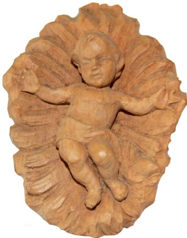
Das Angerührt-Sein vom kleinen Kind kann man groß werden lassen. Ausschnitt aus der Kirchenkrippe in Goldwörth.

Solange Menschen sich ansprechen lassen vom Kind, solange sie zärtliche Rührung empfinden, ist Hoffnung für die Welt. Diese Regung ist kostbar. Es geht nicht gleich um den großen Glauben, der sich an den schweren Fragen und bitteren Momenten des Lebens zu bewähren hat. Gott kam im Kind, sodass Menschen auch mit ihren kindlichen Gefühlen glauben lernen können. Gut soll es ihm gehen. Dieses Angerührt-Sein vom kleinen Kind kann man groß werden lassen. Dann wächst es sich aus zum Gespür für den Nächsten. So wird Hoffnung groß.