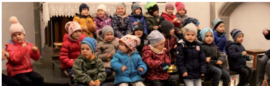
Die Kinder bei der Feier in der Pfarrkirche.

Bei gutem Wetter konnte der gemütliche Ausklang mit Speis und Trank dieses Mal wieder vor unserem Kindergarten durchgeführt werden.