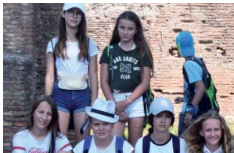
Die Romwallfahrt war für die Minis ein ganz besonderes Erlebnis. Kreiner